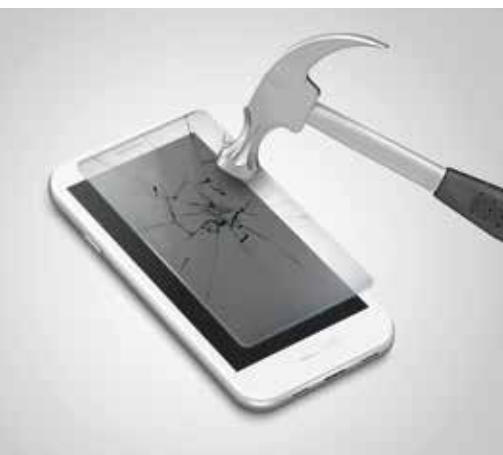
9H ++ Ultra Strong Tempered glass