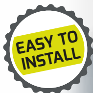
Easy to install Bubble free & strong fixation